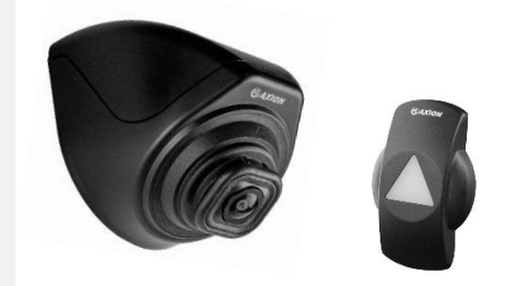
AI40-Kamera mit ICA-CB402 Design-Gehäuse